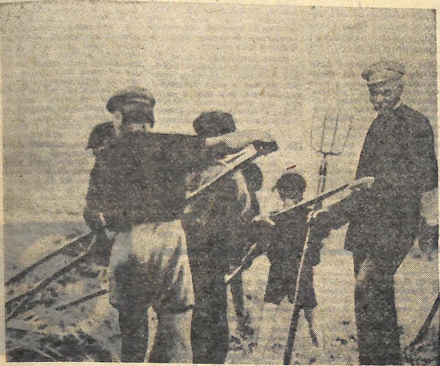
На фото: О. М. ГОРЬКИЙ на святі першого снопа в колонії у 1928 році.

СОЦІАЛІСТИЧНА держава не може бути здійснена, — підкреслював Горький, — якщо діти не будуть соціалістами. Ось чому він уважно слідкував за становленням радянської школи, комуністичним вихованням молоді. Яскраве підтвердження останнього — діловий контакт і моральна підтримка Горьким діяльності А. С. Макаренка в трудовій колонії для неповнолітніх правопорушників, яка стала носити його ім'я.