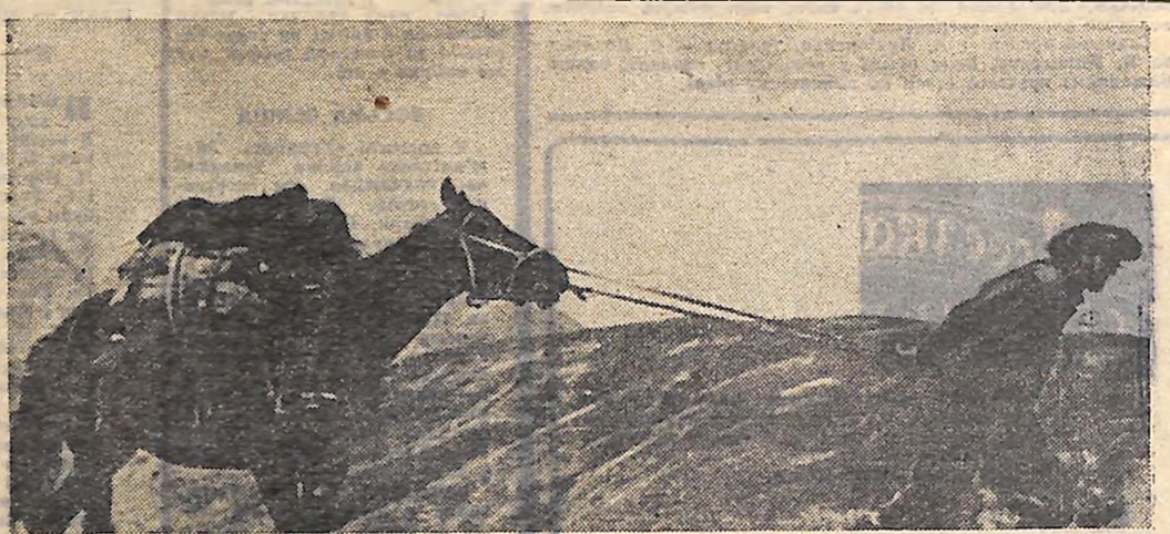
Кадр з фільму «235 мільйонів облич». Виходить геолог у трудну дорогу.

УЧАСНА естрадна пісня — це, перш за все, мистецтво молодості, душевного світла, мистецтво, що розвивається з великою швидкістю, бо воно не втрачає духу виконавчого експерименту.