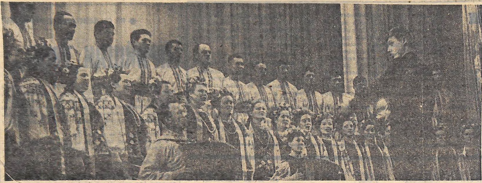
Закінчилася обласна декада хорового співу. У заключеному концерті свою майстерність продемонстрували заслужена хорова капела УРСР Палацу культури ім. Жовтня кіровоградського заводу «Червона зірка», жіночий хор педінституту, жіночий хор колгоспів ім. Лівитинова Новоархангельського району та «Світланок» Новоукраїнського району, вокальний ансамбль Вільшанської райспоживспілки, ансамбль бандуристів Рівнянського Будинку культури Новоукраїнського району, хор Мало-Висківського цукрозаводу, самодіяльний народний хор колгоспу «Родина» Кіровоградського району та інші колективи. На фото: пісню «А в полі береза» виконує хор колгоспу імені Лівитинова Новоархангельського району.