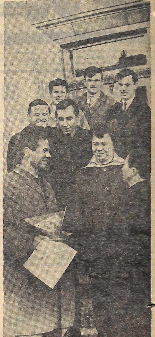
Приз вручено. Кіровоградці вітають переможців.

Вона раніше вважала, що в «прожектористів» один ліхтар. Тепер переконана: їх десятки, а променів — сотня.