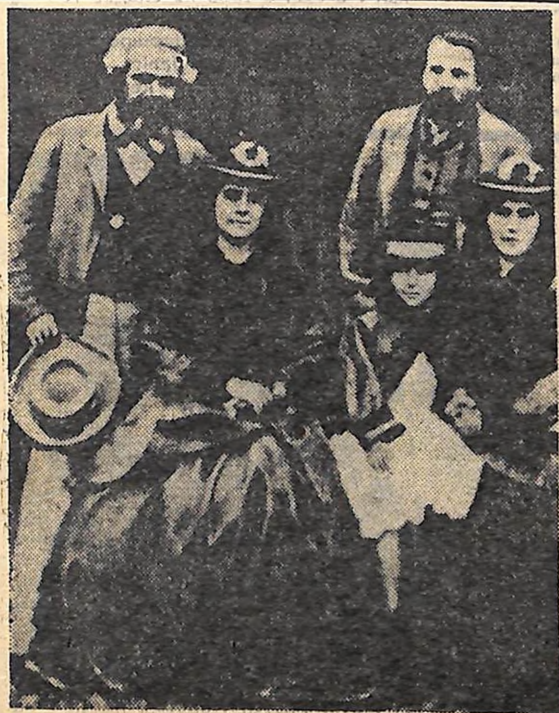
К. Маркс і Ф. Енгельс в доньках Й. Маркса.

П. ДМИТРЕНКО, завідуючий Будинком атеїзму.