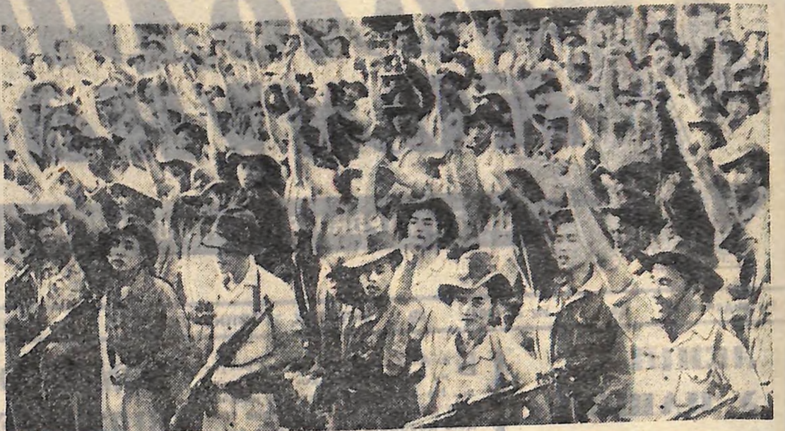
Мітинг в одній з частин народних збройних сил у Південному В'єтнамі. Біліці, натхнені успішним наступом Армії Визволення, висловлюють свою рішучість домогтися нової і остаточної перемоги.