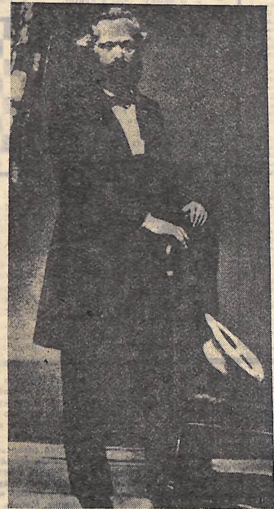
К. Маркс. 1861 рік.

І насправді, Енгельс трохи раніше Маркса звернувся до утопічного комунізму і раніше почав займатися критикою англійської політичної економії. «По стопах» Енгельса став цікавитися досягненнями суспільних наук.