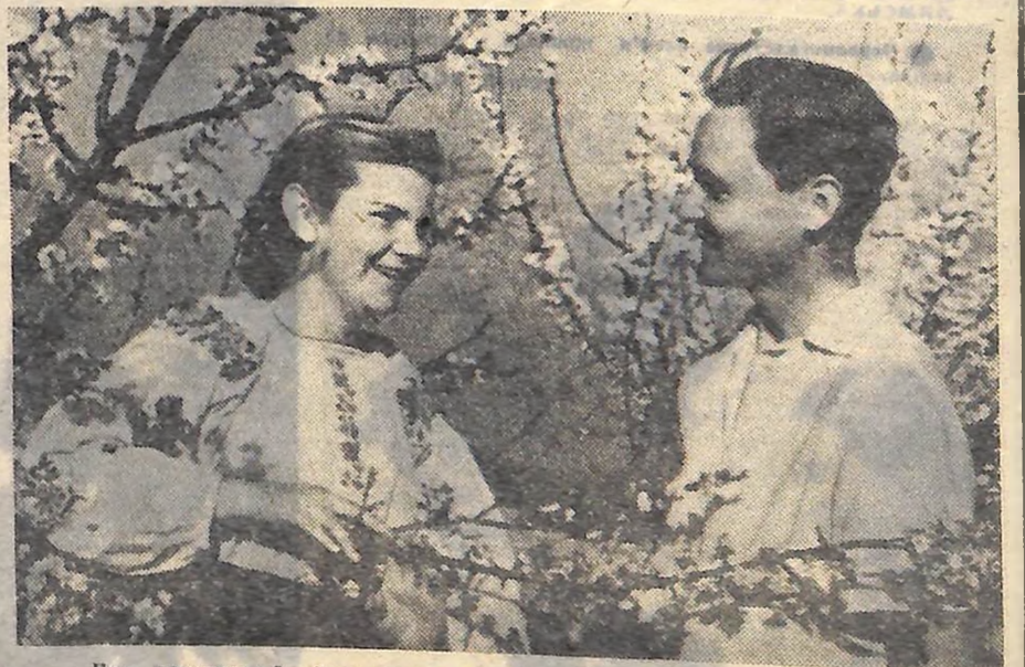
Вліч познатаний фотокореспондент А. Дібровий зробив цей знімок... Він міг його зробити в будь-якому куточку орденоносної Кіровоградщини, де молоді, іде до сонця, до ясної мети, кохається з весняним цвітом.

...І ВЕСНАМ СМІЯТИСЬ, І КВІТНУТЬ, ЯК САД!