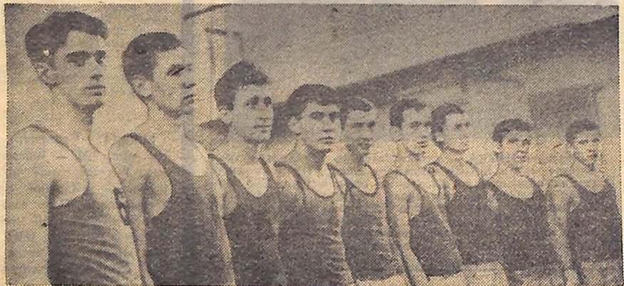
Збірна баскетбольна команда Олександрії — одна з найсильніших серед авангардівських колективів області, призер першості об'єднання ДССТ «Авангард».