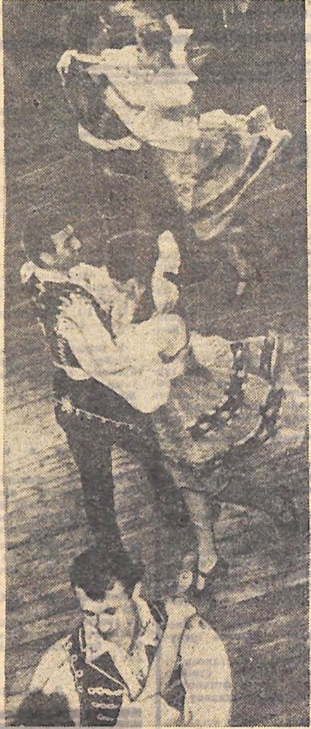
На знімку: танцює «Юність».

городжено Дипломом першого ступеня за першість серед педагогічних Інститутів республіки, його чекав дорожок до Бельгії на фестиваль народного танцю. На третій обласній декаді народного танцю, що закінчилася недавно, «Юність» стала володарем кубка й Диплома першого ступеня. Такої ж нагороди вона була удостоєна і на другій обласній декаді. Цими днями «Юність» вирушила в подорож по області. Вона запропонує глядачам зав'язану «Карусель», запальний «Молодіжний», темпераментний «Чардаш» і багато інших цікавих номерів. Гроші, зібрані під час гастролей, підуть у фестивальний фонд — фонд солідарності з волелюбним В'єтнамом. С. ШЕВЧЕНКО.