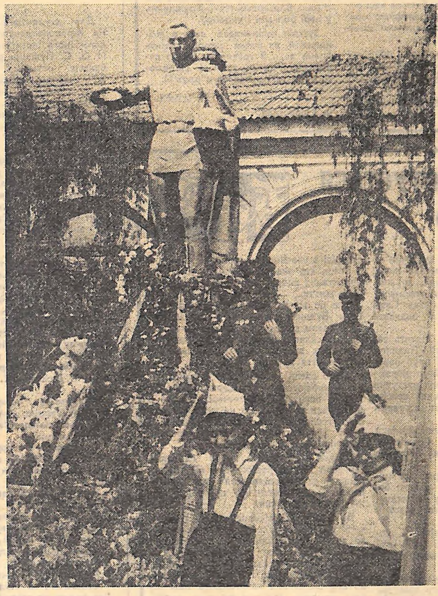
День Перемоги. Почесна варта біля пам'ятника Невідомому солдату.

8 травня в Москві відбулася зустріч керівних діячів Болгарської комуністичної партії, Угорської соціалістичної робітничої партії, Соціалістичної єдиної партії Німеччини, Польської об'єднаної робітничої партії, Комуністичної партії Радянського Союзу. У зустрічі взяли участь: Перший секретар ЦК БКП, Голова Ради Міністрів НРБ тов. Тодор Живков; Перший секретар ЦК УСРП тов. Янош Кадар; Перший секретар ЦК СЄПН, Голова Державної ради НДР тов. Вальтер Ульбріхт; Перший секретар ЦК ПОРП тов. Владислав Гомулка; Генеральний секретар ЦК КПРС тов. Л. І. Брежнев, член Політбюро ЦК КПРС, Голова Президії Верховної Ради СРСР тов. М. В. Підгорний, член Політбюро ЦК КПРС, Голова Ради Міністрів СРСР тов. О. М. Косигін, секретар ЦК КПРС тов. К. Ф. Катусев. У ході зустрічі відбувся обмін думками про актуальні проблеми міжнародного становища і світового комуністичного і робітничого руху. Учасники зустрічі інформували один одного про становище в своїх країнах і висловили тверду рішучість й далі всіляко розвивати відносини дружби і всебічного співробітництва на основі принципів марксизму-ленінізму, пролетарського інтернаціоналізму. Зустріч пройшла в атмосфері дружби і сердечності.