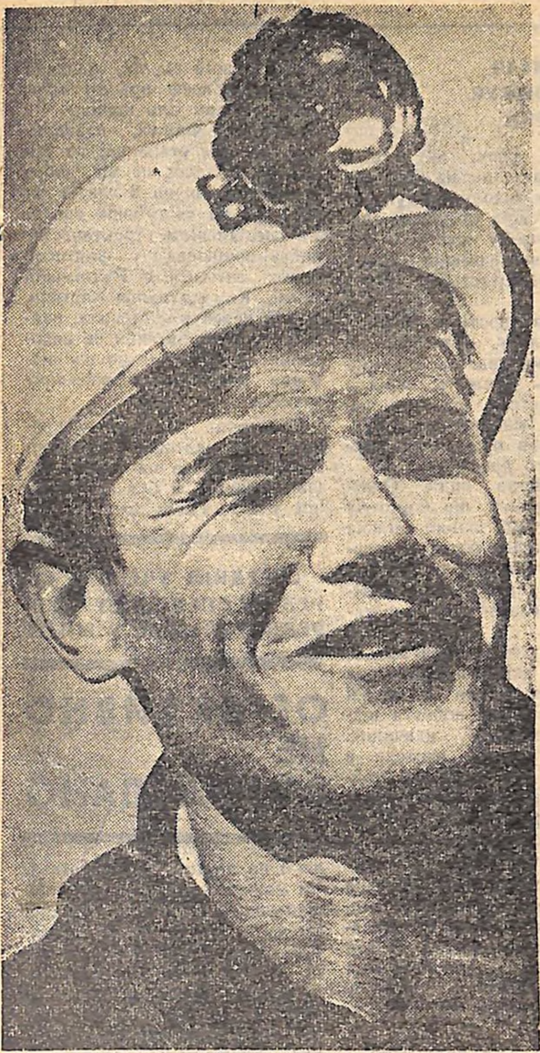
● ИДЕМО НА ПОДВИГ ШОСТИЙ