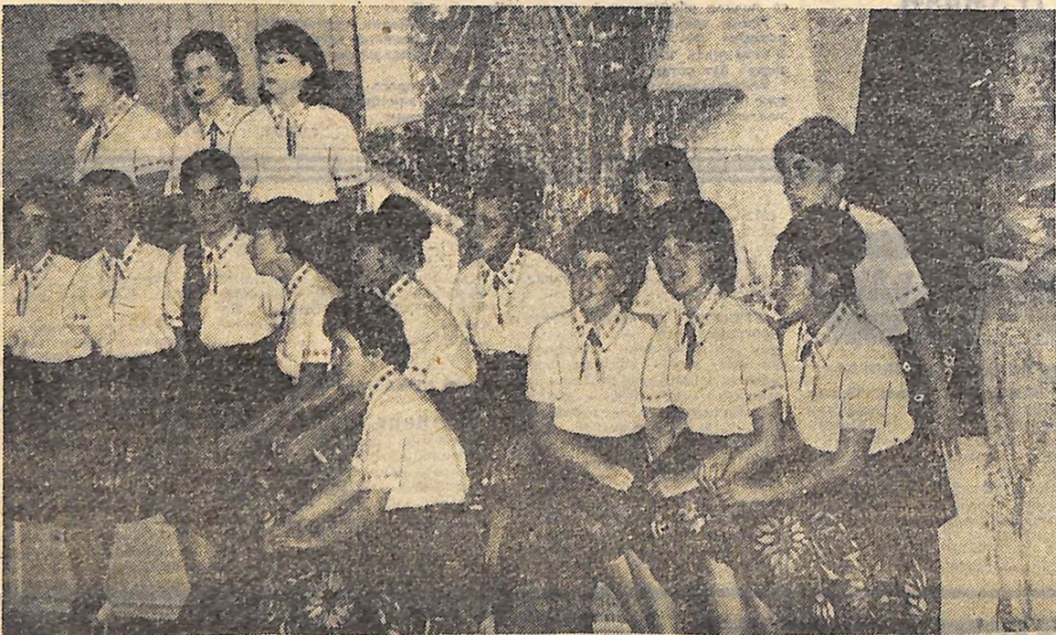
Молодіжний ансамбль «Дніпрячка» Палацу культури імені В. І. Лєніна добре знайомий у місті Кремесі. Де б він не виступав, повсюди глядачі нагороджують щедрими оплесками за майстерність.

На фото: хорівий колектив ансамблю виступає на черговому «вогнику».