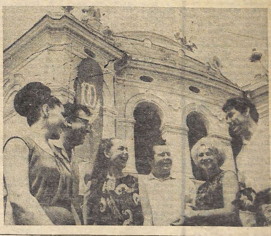
ДО 100-РІЧЧЯ З ДНЯ НАРОДЖЕННЯ В. І. ЛЕНІНА

Важливим завданням, говорилось на засіданні, є зміне поєднання потреб окремих галузей народного господарства в кадрах з побажаннями молоді, раціональне і своєчасне влаштування всіх випускників шкіл на роботу чи навчання з тим, щоб кожен з них знайшов гідне місце в житті нашої країни. (РАТАУ).