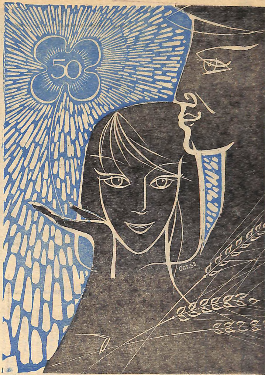
Малюнок В. ОСТАПЕНКА.