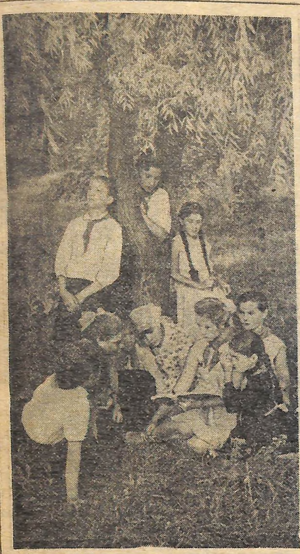
Книга про Ілліча,