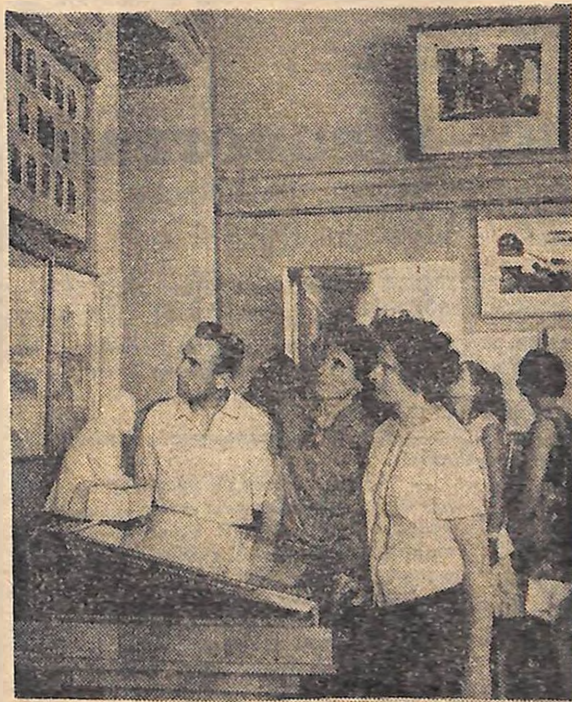
В Х залі Київського філіалу Центрального музею В. І. Леніна, де експонуються документи Першого з'їзду Комуністичної партії (більшовиків) України.