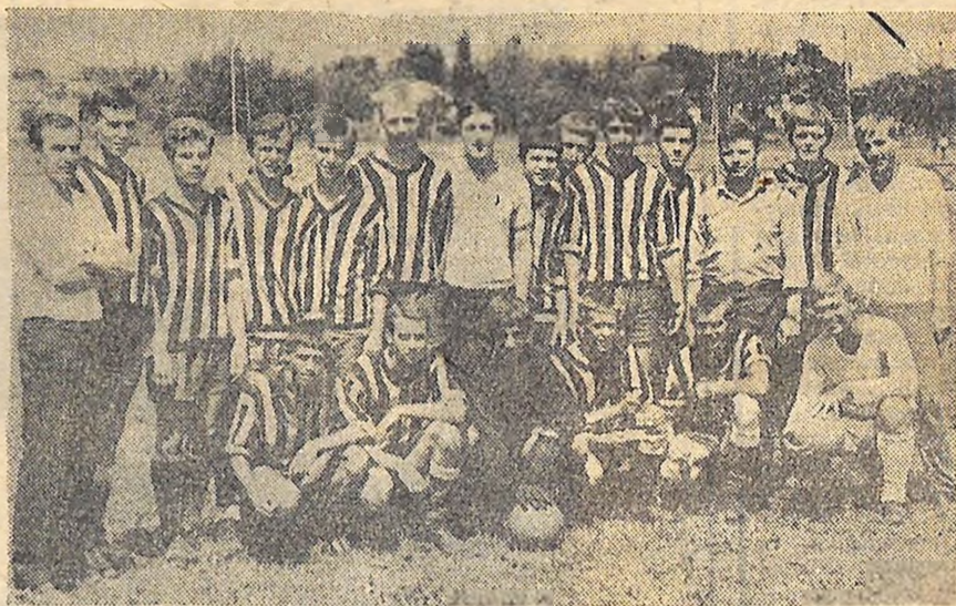
На фото: юні футболісти Кіровоградської області, які завоювали право виступати у фінальних іграх XXIII республіканської спартакіади школярів.

На кортах школи-інтернату № 1 закінчилась зональна першість республіки серед школярів з теніса.