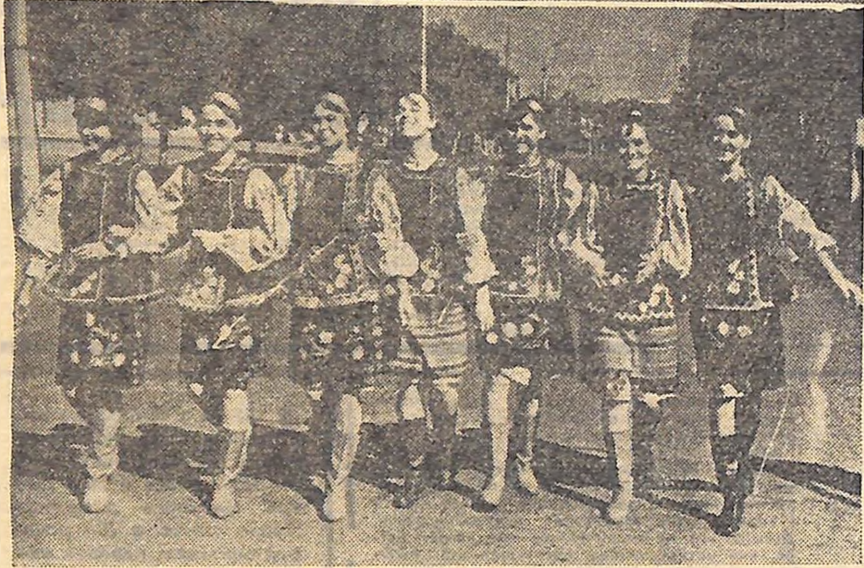
На фото: відзначення на-родного свята Івана Купала в Млиовицькому районі.

Все було як в давні-пре-давні часи. Але старовин-ний народний обряд на-брав нового змісту. Дізча-та кидали на воду по два віночки, ще один з пше-ничного колосу — нехай буде врожай великий. Дів-чата й хлопці співали нові пісні на зелених берегах Висі. Про рідну землю, про діла добрі і дні щас-ливі. Знову й знову до пізно-го вечора на зміну весе-лим хоровам і сьго-часним ліричним пісням приходила, мов з казки-феєрії, ота давня пісня «Купала на Івана».