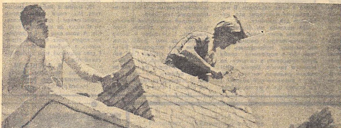
● ДЛЯ ЮВІЛЕЙНОГО ГОСТИНЦЯ

га районних комісій по трудовлаштуванню. Вони майже зовсім випустили з поля зору стан готовності підприємств до прийому на роботу випускників, не приділяють належної уваги проведенню урочистих посвячень юнаків і дівчат у молоді робітники, врученню трудових книжок, першої заробітної плати тощо.