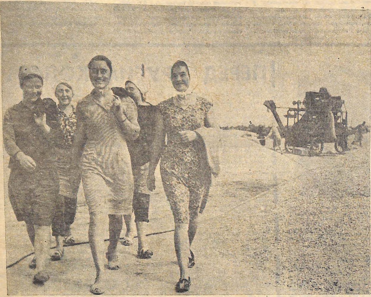
...Зміна закінчилась. Тепер — до села...

ЦЕЙ РІК виявився щасливим для жителів с. Нечаївки Компаніївського району: в селі почали будувати школу. Та й не яку-небудь, а двоповерхову, на 320 місць. І школярів, і їх батьків аж ніяк не образило те, що приміщення її буде не в центрі села, а на самісінькій околиці.