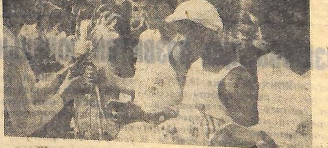
24-го липня кіровоградці тепло привітали учасників надмарфонського пробігу Волгоград — Ужгород.