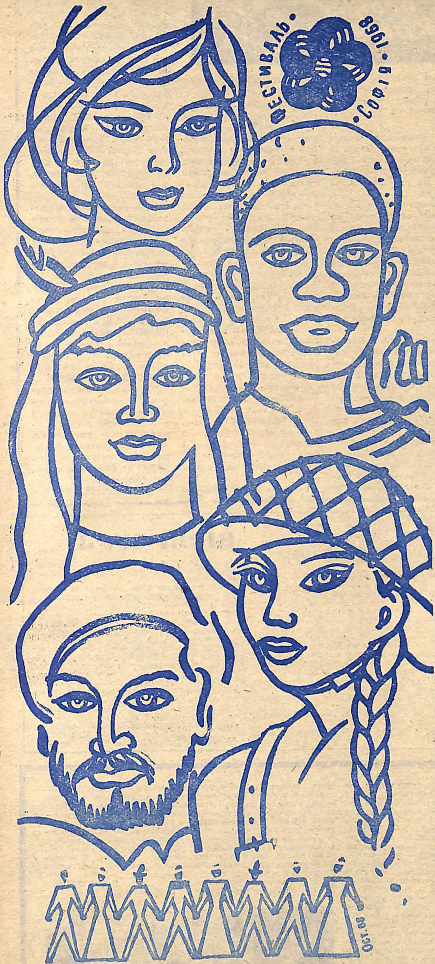
Малюнок В. ОСТАПЕНКА.