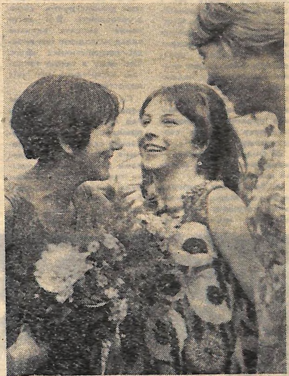
Учасники танцювального колективу «Юність» Кіровоградського педінституту щойно зійшли з літака...