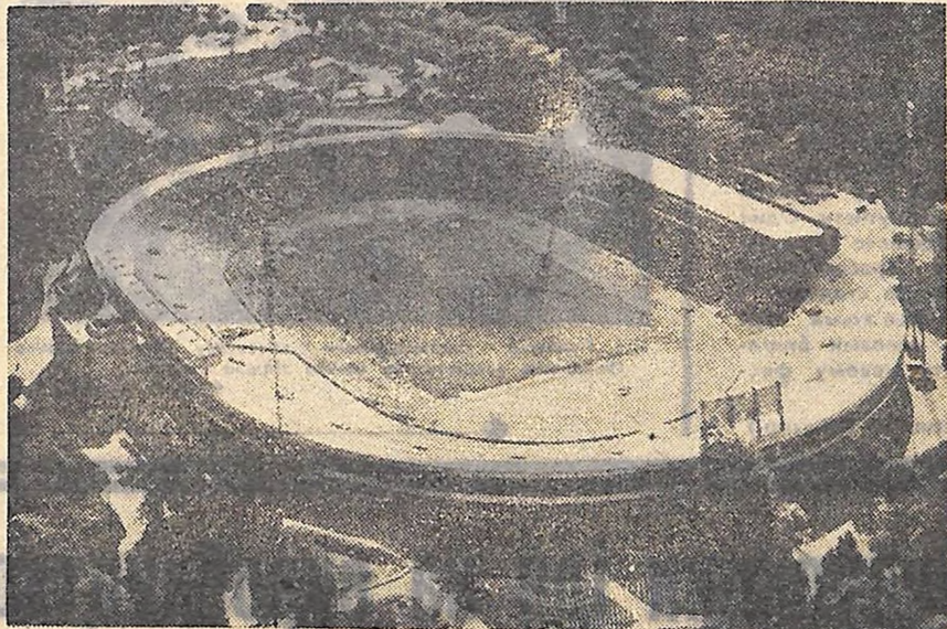
Тут, на стадіоні імені Василя Левського, зібралися позавчора посланці молоді 143 країн.

Д. БОЧАРОВ, І. ВЕК-СЛЕР, І. ДОБРОТІНА, В. ЧУКСЄЄВ, В. ЧАНТУРІЯ — спецкор. ТАРС.