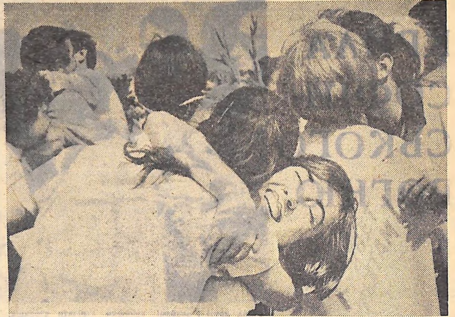
До пізнього вечора — вітання, вітання, вітання...

м. Кіровоград, вул. Луначарського, 36. Телефони: секретаріату — 2-45-35, відділів — 2-45-36.