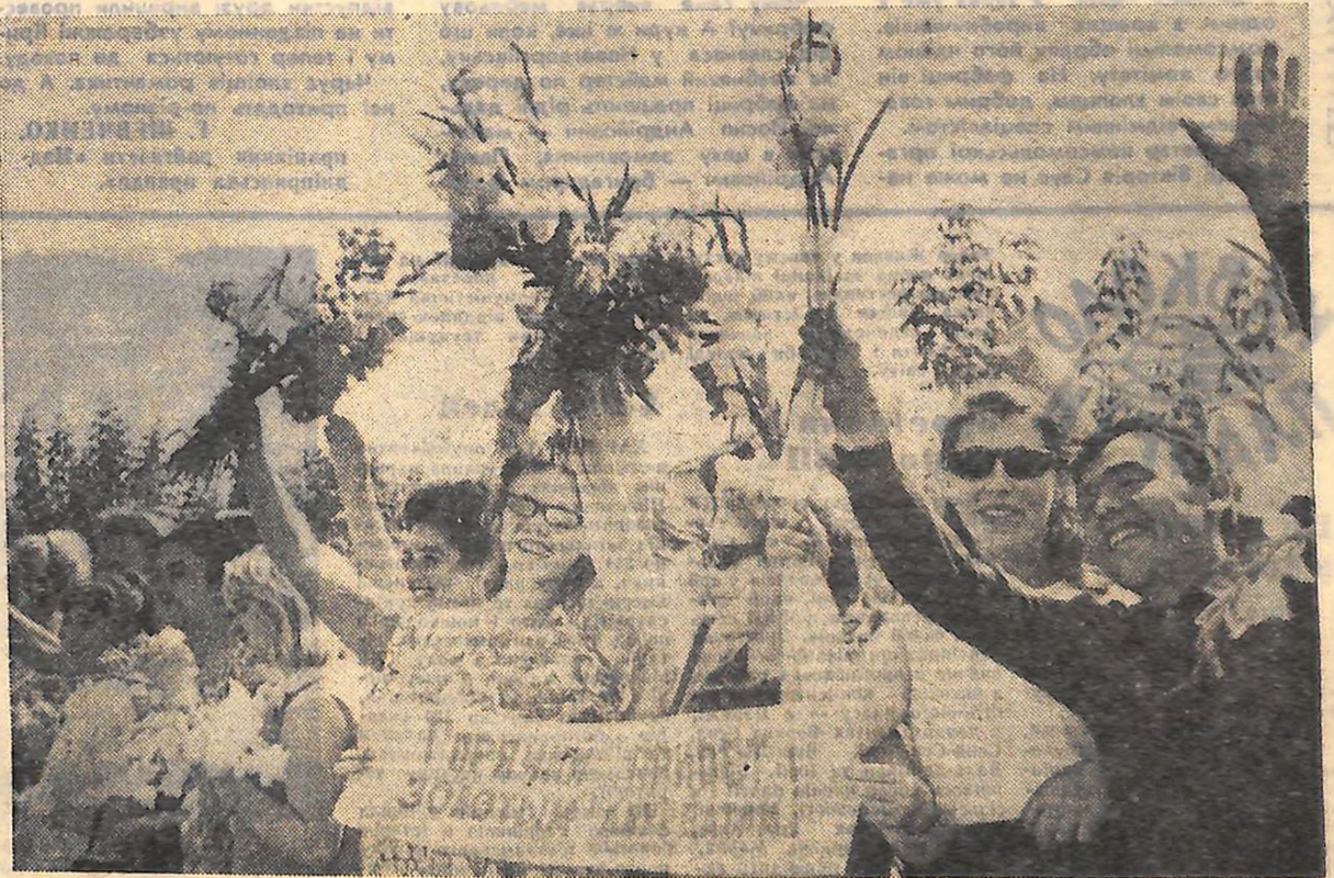
Море квітів зацвіло на аеровокзалі...