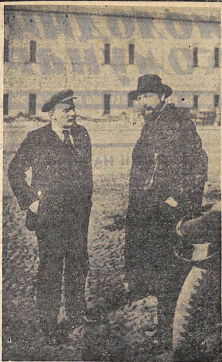
В. І. Ленін і В. Д. Бонч-Бруєвич на подар'ї Кремля, Вересень 1918 року.