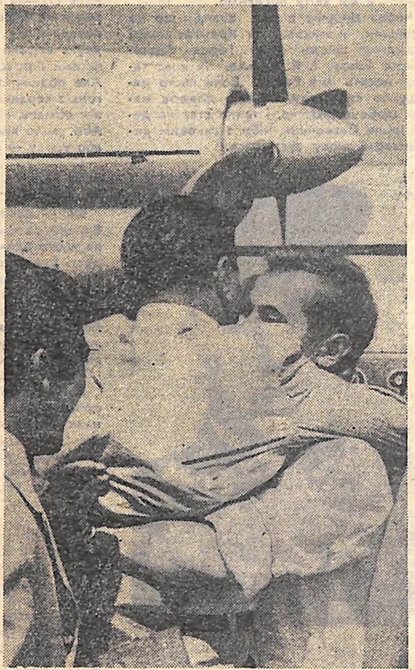
Здрастуй, земле кіровоградська!

Вода (окис водню) H 2 O — найпростіша хімічна сполука водню з киснем. При нормальних умовах вода — безколірна... Вода входить до складу ґрунту, багатьох мінералів і гірських порід, є складовою частиною всіх живих організмів.