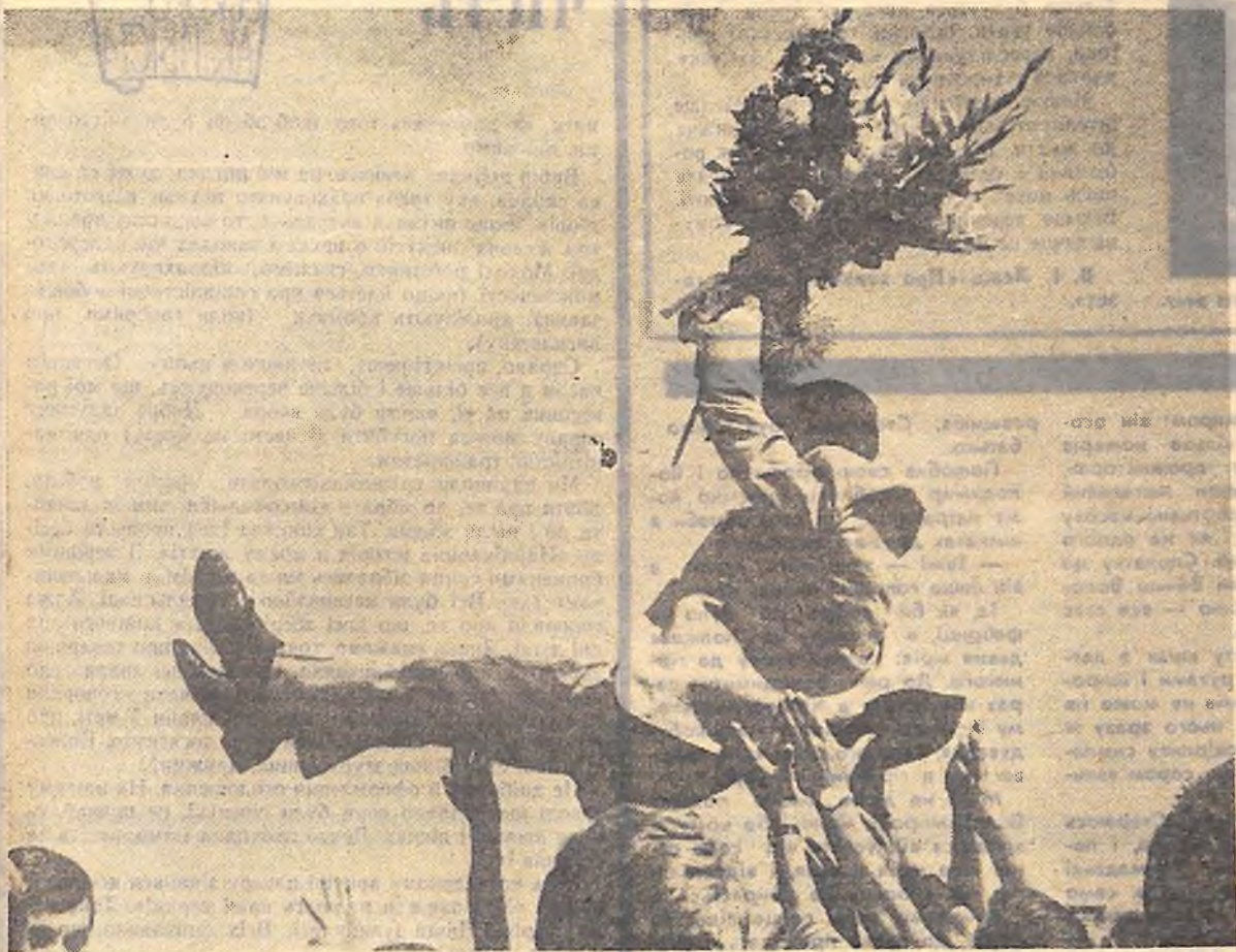
«Ура!» — Анатолію Михайловичу Кривоножкі.

Різні подарунки готує молодь до комсомольського ювілею. Новоархангельці, наприклад, вирішили спорудити стадіон. Вибрали чудове місце — берег Синюхи. Укріпили тут циток з написом: «Комсомольсько-молодіжна будова на честь 50-річчя ВЛКСМ». І тепер майже кожного вихідного дня на об'єкті можна зустріти десятки юнаків і дівчат. На недільники приходять. Особливо старається молодь районного об'єднання «Сільгосптехніки», медичної лікарні, райспоживспілки міліції, району електросіток. Трибуни для глядачів з чотирма секторами на 3 тисячі місць уже готові. Бригади мулярів Віктора Мориньова і теслярів Володимира Артема з міжколгоспбуду кінчають опоряджувати душові, роздягальні.