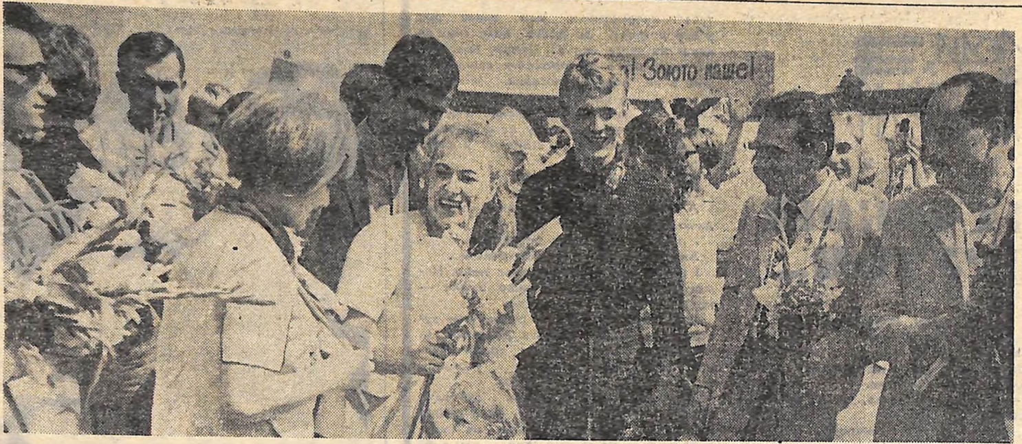
Рідні, друзі і знайомі прийшли стрітати ятранців.