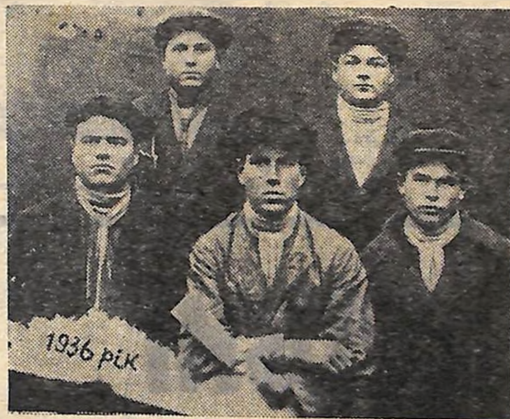
1936 рік. Кращі трактористи Грушківської МТС.

А в передовій: «...Колгоспники села Грушки першими в районі закінчили весняну сівбу, одними з перших зібрали урожай, достроково, до 15 серпня — виконали план хлібоздачі і натуроплати».