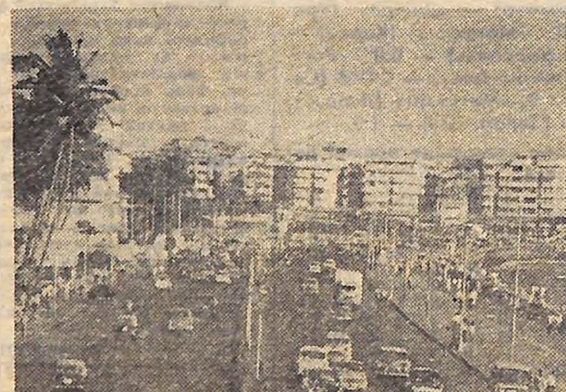
Сьогодні — День незалежності Індії.

На знімку: набережна Марін Драйв — «Перлове пам'ятки» найбільшого міста Індії Бомбея.