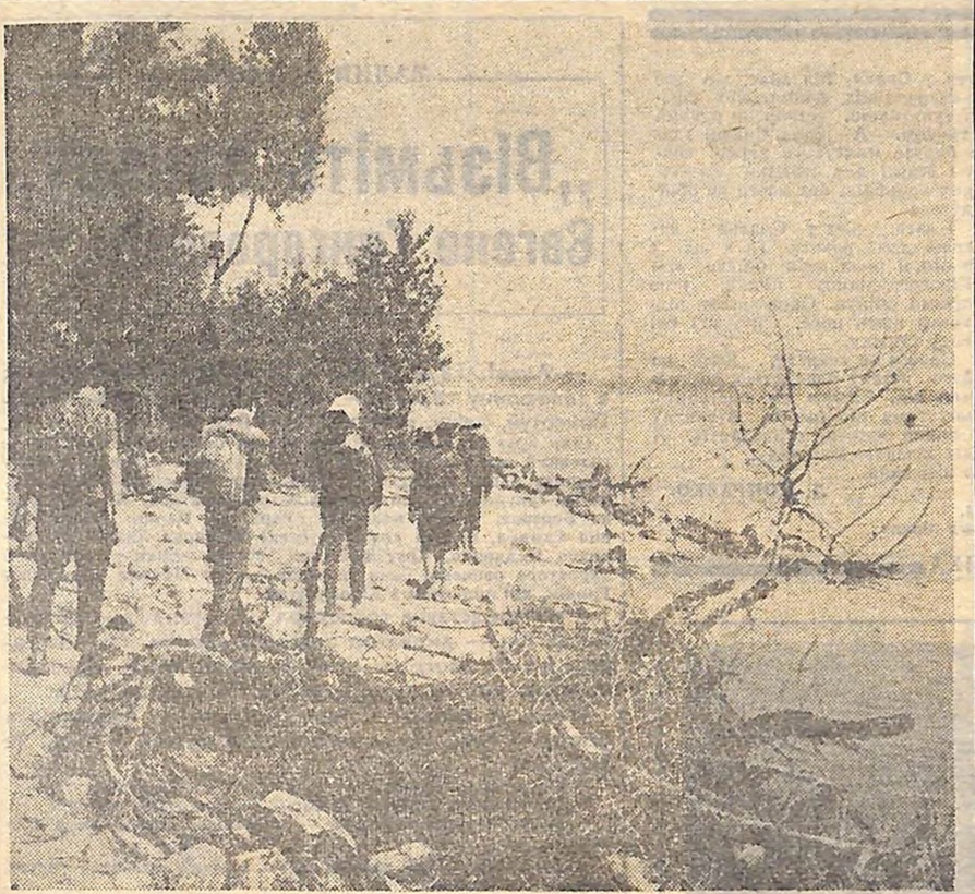
...Закінчуються стежини літа.