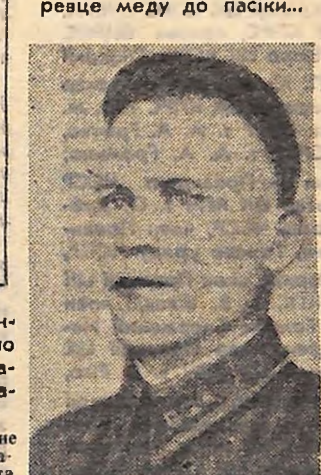
На фото: Степан Скрипник. Фото 1941 року.