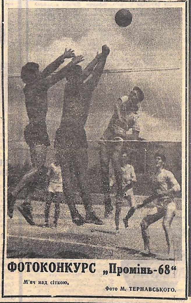
ФОТОКОНКУРС „Промінь-68“ М'яч над сіткою

На фото: кіровоградські гандболісти, переможці першості республіканської ради ДСТ «Спартак».