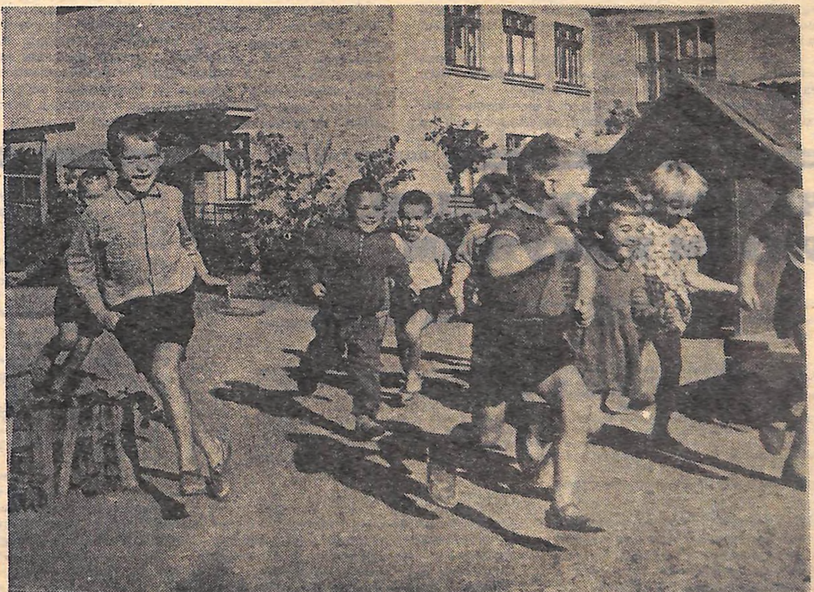
В дитячому садку № 3 міста Бобринця.

Учасники семінару прослухали лекції з історії комсомолу області, про міжнародне становище, на секційних заняттях одержали методичні поради, обмінялися досвідом роботи.