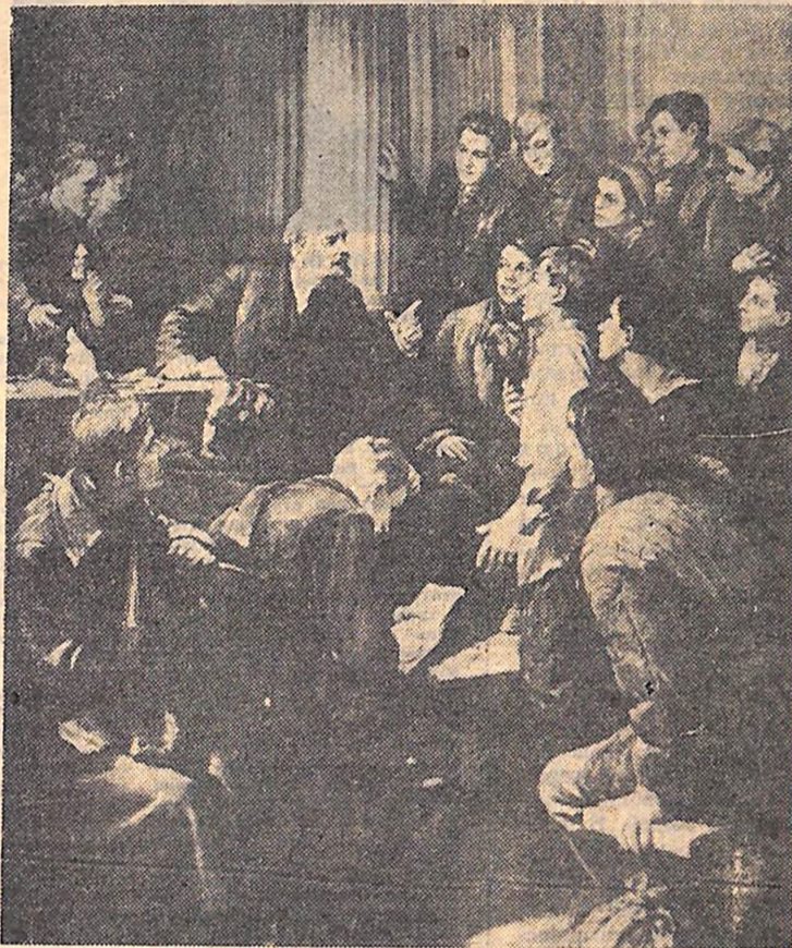
В. І. Ленін з делегатами III з'їзду РКSM.

Завдання спілки молоді — поставити свою практичну діяльність так, щоб, навчаючись, організуючись, згуртовуючись, борючись, ця молодь виховувала в себе і всіх тих, хто в ній бачить вождя, щоб вона виховувала комуністів. Треба, щоб уся справа виховання, освіти і навчання сучасної молоді була вихованням в ній комуністичної моралі.