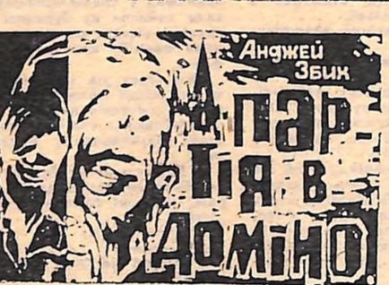
(Закінчення. Початок в газетах за 24 і 26 вересня).

зіграли вничю із залізничниками і перемогли команду «Буревісника». У жінок вже виявився переможець. Ним стала команда ДСТ «Авангард». Спортсмени студентського товариства на другому місці, гандболістки «Локомотива» — на третьому.