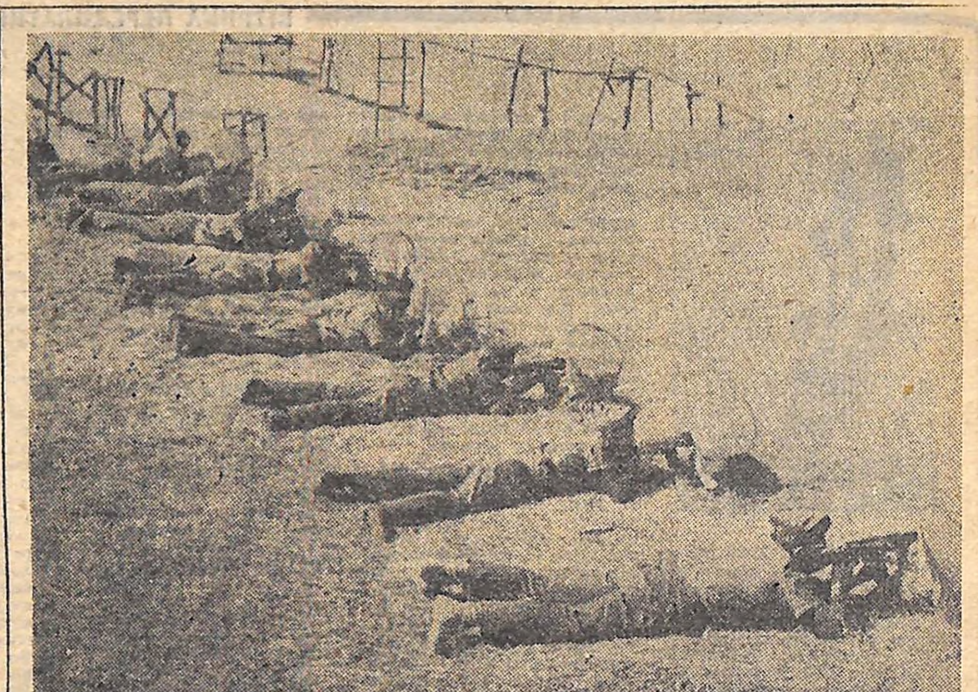
Фотоконкурс „ПРОМІНЬ-68“ Майбутні воїни.