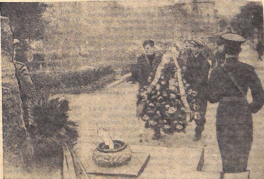
Учасники урочистого пленуму обкому і міському ЛКСМУ покладають вінки до пам'ятника Невідомому солдату.

За дев'ять місяців було впроваджено в народне господарство 1,8 мільйона винаходів і раціоналізаторських пропозицій, що дало більш як 1,4 мільярда карбованців економії в розрахунку на рік. (ТАРС).