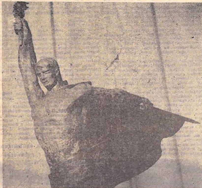
Ескіз пам'ятника героям-комсомольцям Кіровоградщини. Робота скульптора Амі- рана Дейсадзе, експонована на виставці.

Б. КУМАНСЬКИЙ, студент Ленінградського худож- нього інституту ім. І. Ю. Рєпіна.