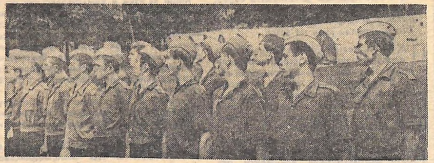
Шороку в лави Радянської Армії вливається новий загін молодих воїнів. Серед них — і наш земляки, юні кіровоградці. Приймаючи присягу, вони клянуться бути вірними справі Леніна, пишно стояти на сторожі завоювань Жовтня. Вітчизна довірила степовикам найновішу сучасну зброю, яка в руках наших земляків — надійний щит від будь-якого агресора.

Мітинг оголошується закритим. Урочисто лунає Державний Гімн Української РСР.