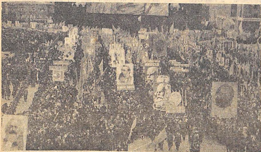
Москва, 7 листопада 1968 р. Демонстрація представників трудящих на Красній площі.