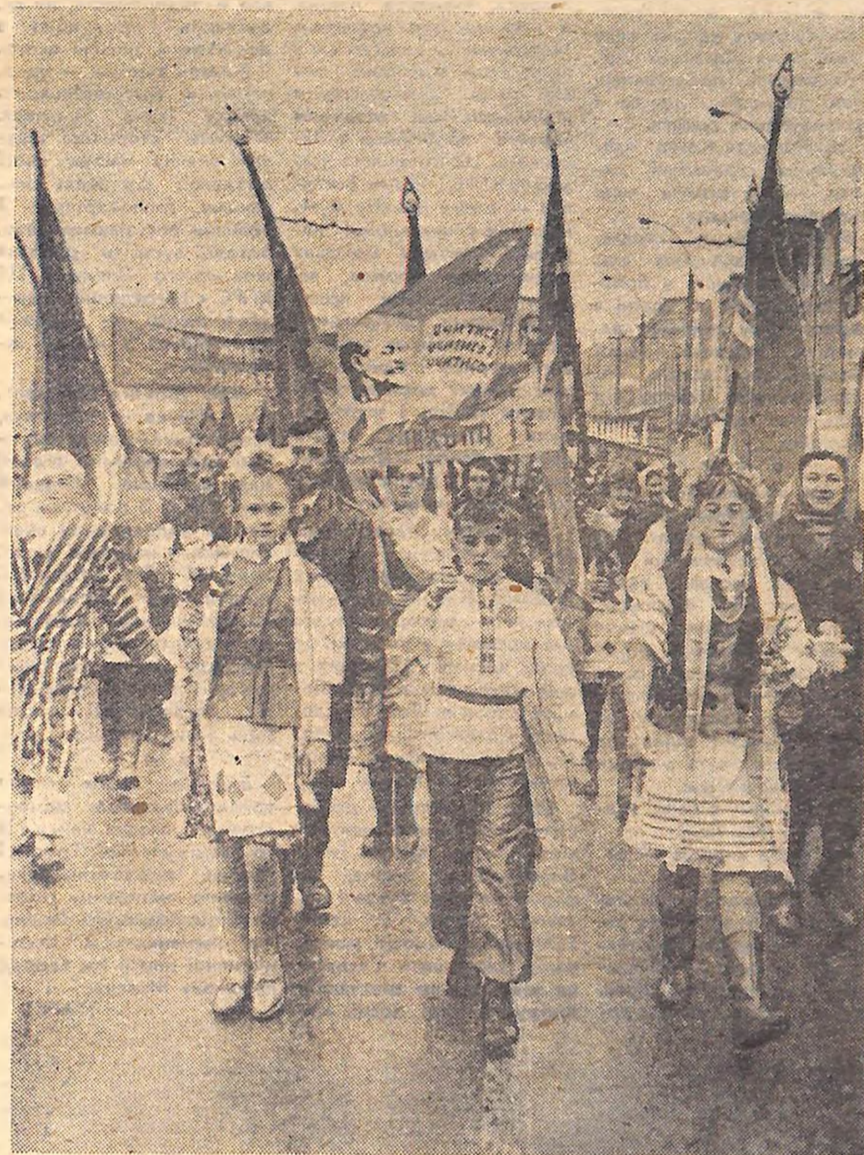
Разом з своїми батьками святковими вулицями Кіровограда пройшли школярі.

Іде колона балістичних (Закінчення на 2-й стор.).