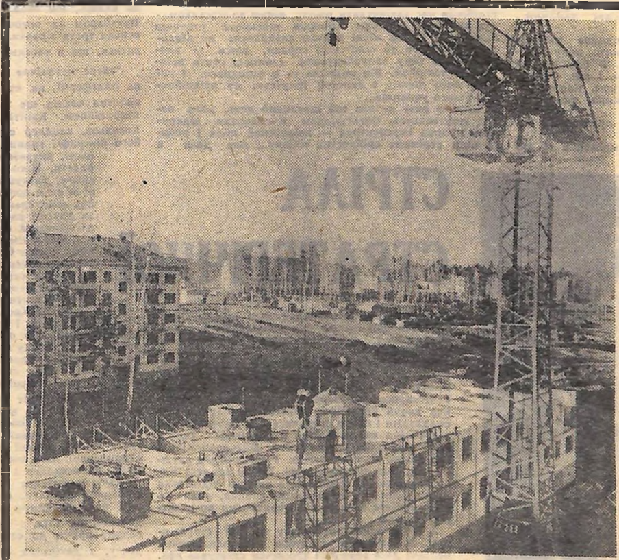
Братськ продовжує будуватись. Жилі квартали ростуть з великою швидкістю, рухаючись у бік штучного моря на Ангари. 90 — 100 тисяч квадратних метрів житлової площі щорічно здають будівельники міста. На знімку: будівництво житлових будинків в Братську.

Наприкінці роботи Пленум обговорив і прийняв проект резолюції про головні завдання партії на найближчий період».