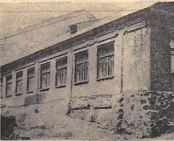
Паровозне депо, де працювали підпільники.