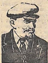
До 100-річчя від дня народження В. І. Леніна