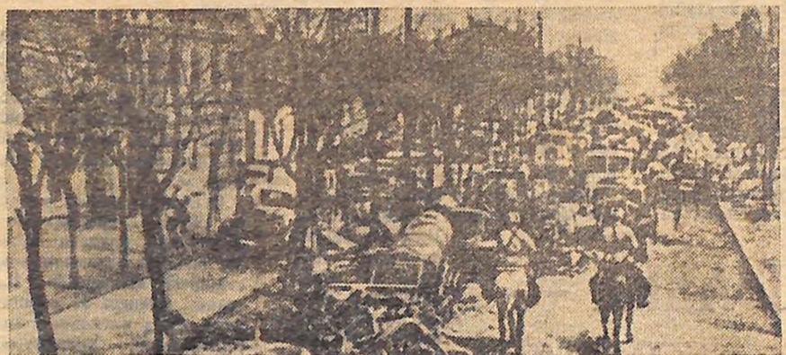
Кіровоград в перший день після звільнення. Фото 1944 року.

409 стрілецька Кіровоградська дивізія, 25 танкова Кіровоградська бригада, 31 танкова Кіровоградська бригада, 170 танкова Кіровоградська бригада, 1-й штурмувальний авіаційний Кіровоградський корпус, 1-а Гвардійська бомбардувальна авіаційна Кіровоградська дивізія, 205 винищувальна авіаційна Кіровоградська дивізія, 302 винищувальна авіаційна Кіровоградська дивізія, 11 артилерійська Кіровоградська дивізія, 16 артилерійська Кіровоградська дивізія, 1000-й винищувальний протитанковий артилерійський Кіровоградський полк, 1669-й винищувальний протитанковий артилерійський Кіровоградський полк, 679-й гаубичний артилерійський Кіровоградський полк, 1543-й самохідний артилерійський Кіровоградський полк, 1694-й самохідний артилерійський Кіровоградський полк, 263-й мінометний Кіровоградський полк, 292-й мінометний Кіровоградський полк, 97-й Гвардійський мінометний Кіровоградський Червоно-Прапорний полк, 11-й окремих Гвардійський мінометний Кіровоградський дивізіон, 60 інженерно-саперна Кіровоградська бригада, 329-й інженерний Кіровоградський батальйон.