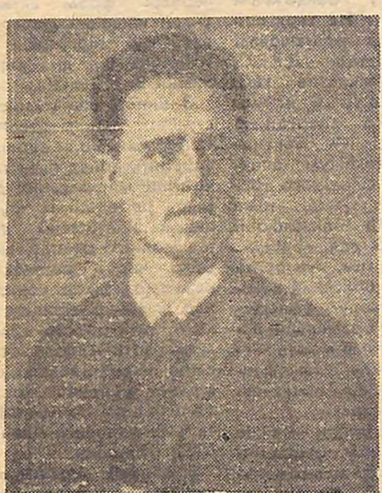
Карл Лібкнехт. Фото 1888 р.

ВІД РЕДАКЦІЇ. Цією статтею ми розпочинаємо розмову про роль комсомольських організацій підприємств у боротьбі за високу якість продукції, про участь членів Спілки в господарському житті підприємства в умовах нової системи планування та економічного стимулювання. Чекаємо ваших листів з цього приводу.