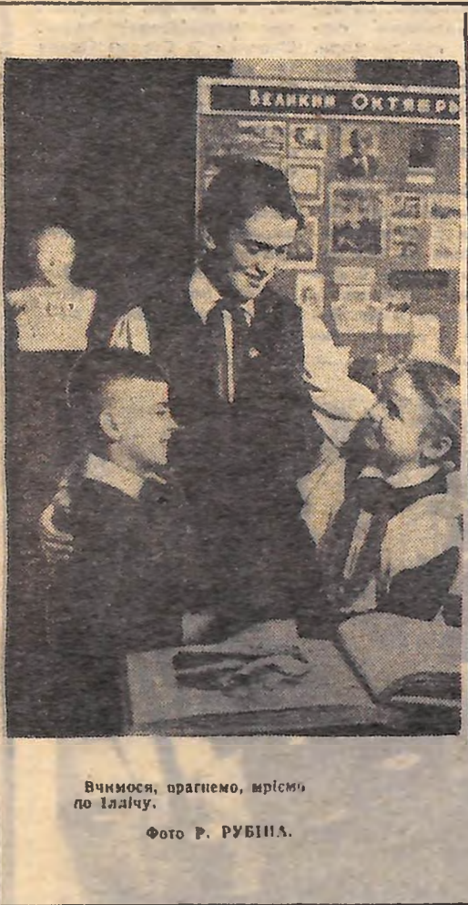
Вчимося, прагнемо, шрмімо по іалічу.