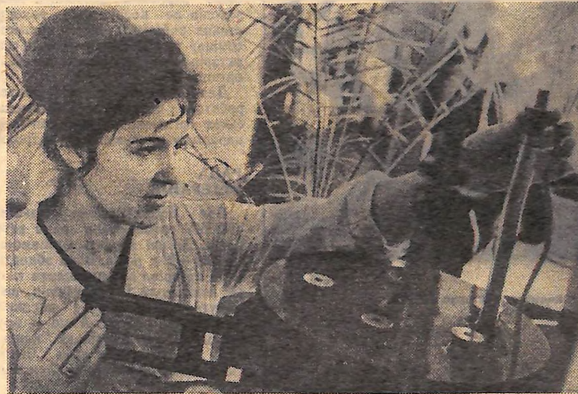
Відлуння заклик одеських кукурудзіводів не минуло Кіровоградський завод гібридного насіння. Щодня він зобробляє 45 тонн зерна при нормі 32 тонн. Високі насіння кукурудзи завод забезпечує не тільки замовників нашої області, а й Вінницької, Сумської та Київської.

Тут все нагадує про Леніна, вчить жити по Іллічу.