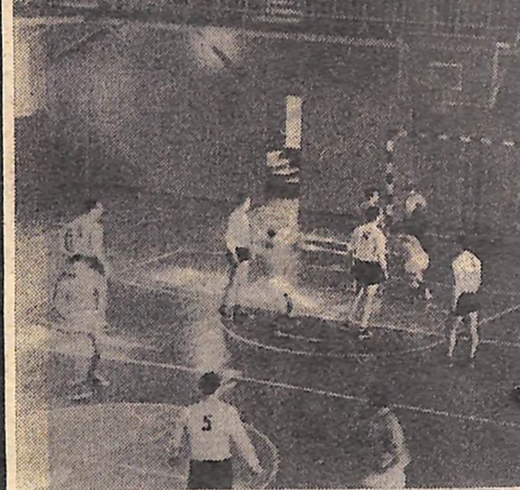
На знімку: момент гри між командами «Колос» і «Буревісник».