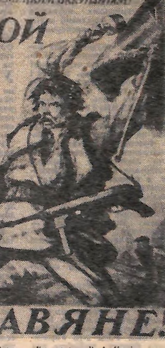
Плакат 1942 року. Художник В. І. Косіян.

Ніше в липні диверсійні групи загону імені Ворошилова під командуванням І. Д. Діброва та комісара К. І. Сабанського сім разів підірвали залізничне полотно і пустили