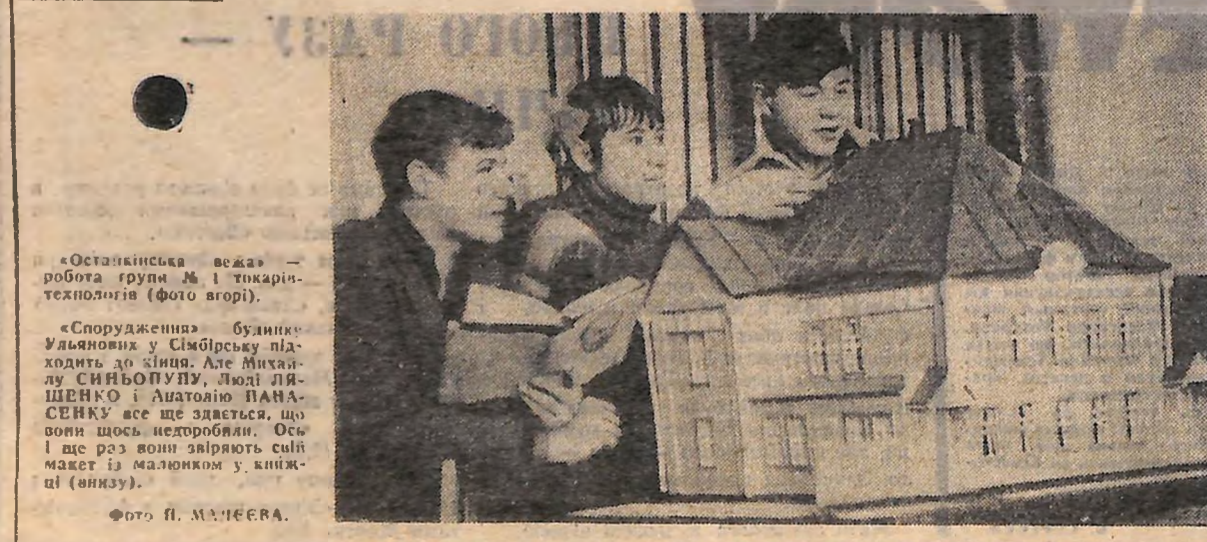
«Останківська вежа» — робота групи № 1 і ткаря-технологів (фото агорі).