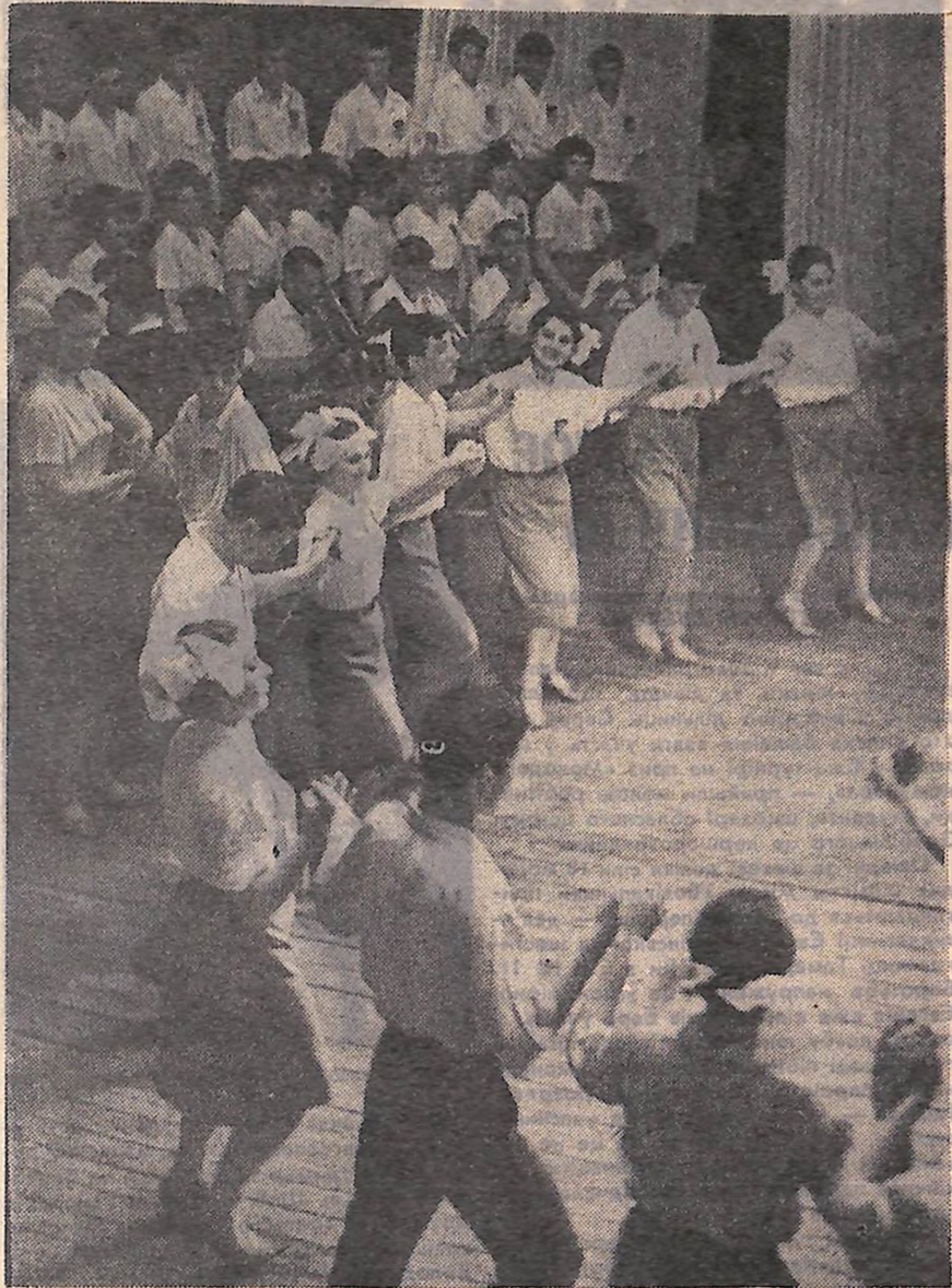
«Кіровоградська полька» у виконанні ансамблю пісні і танцю Будинку культури обласного профтехосвіти.