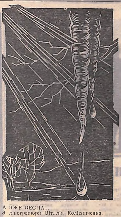
А ВЖЕ ВЕСНА... З ліногравюри Віталія Колесніченка.

— Однією з форм навчання юнаків і дівчат в навчання на громадських засадах. Щороку наші майстри підготовляють таким чином 30-40 молодих спеціалістів. Добре, що за справу взялися і працівники колгоспів. Вони направляють на навчання молодих хліборобів, виплачують стипендії, а ті потім повертаються, щоб обслуговувати своїх односельчан. Вже чимало юнаків уміли повернутися в колгоспи Новомиргородського, Петрівського та деяких інших районів.