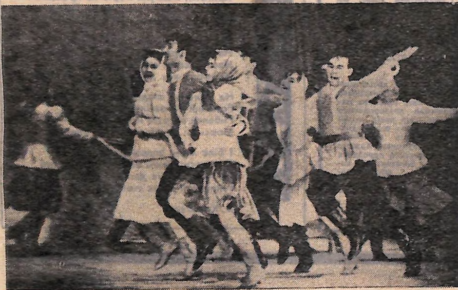
На сцені — студенти Уфимського авіаційного інституту.

Зараз для показу на виставці «ЕКСПО-70» в Японії відібрані дві його роботи: прибор для чаю і башкирський сувенір — ваза. Г. ПІКУШОВА.