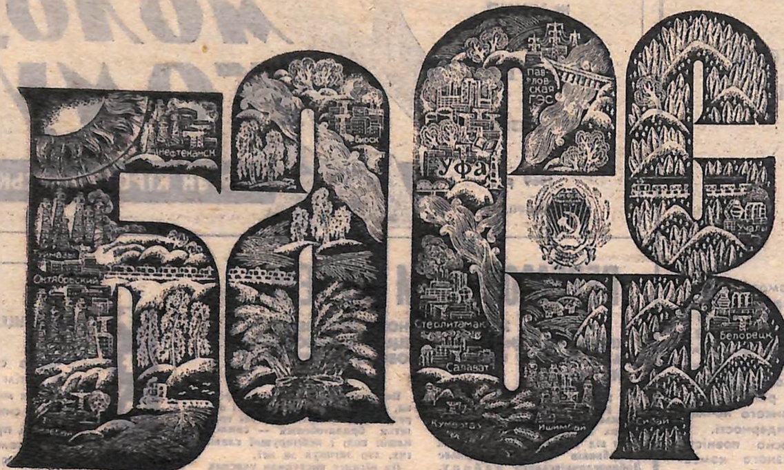
З ГРАВЮРИ БАШКИРСЬКИХ ХУДОЖНИКІВ С. КОВАЛЬОВА ТА В. ДІЛНОВА.

П'ятдесят років тому, 23 березня 1919 року була створена Башкирська АРСР. За радянське п'ятдесятиріччя невпізнанно змінився цей край. Подаємо розповіді про життя молоді братньої Башкирії, підготовлені журналістами башкирської республіканської газети «Ленінець».