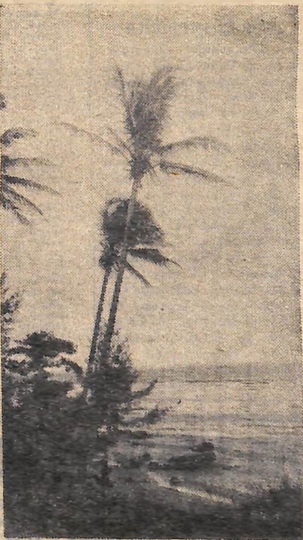
«Відпочинь красуні-пальми». Острів Маврїкїї.