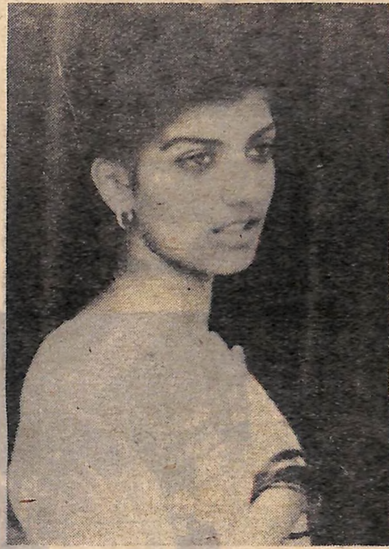
Індїйка Женїї з острова Маврїкїї.

флібустьєри, або інакше «королівські пірати», звозили сюди невілників. Теперішні мешканці острова — давні нащадки невілників. Хлопці-маврїкїї, що прийшли до нас на корабель, запросили відвіати їх клуб... Він знаходився на одній з вулиць Порт-Луї. При вході в клуб — сиблема: мускулатий темі ношкірїї юнак з молотом розбиває ланцюги. Поряд напис: «Ленінська комсомольська організація острова Маврїкїї». Невелике приміщення. Стенд, на якому фотографії знатних людей Радянського Союзу: Гагарїна, Буркацької, Тичини. Тут же великий стенд-виставка, присвячений творчості Тараса Шевченка. Серед книг, які читають маврїкїйські комсомольці, я побачив вірші Маяковського, Комсомору, твори Фадєєва й Островського. Мені радісно було зустрітись на далекому березі з книгою «Юність України», в якій вміщено фотостуд «Поле мого, полечко» — дівчина-українка із збіркою моїх віршів.