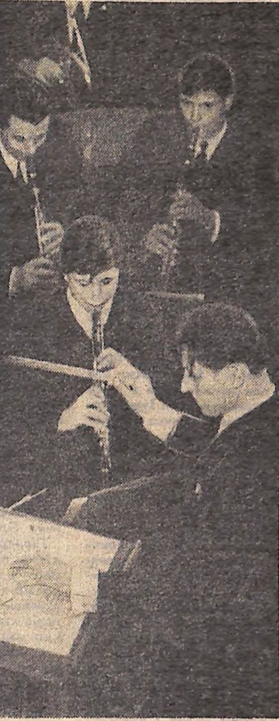
Часто радують глядачів цікавими коп... іями учні Кіровоградського музичного... училища. Багато серед них виконавців...