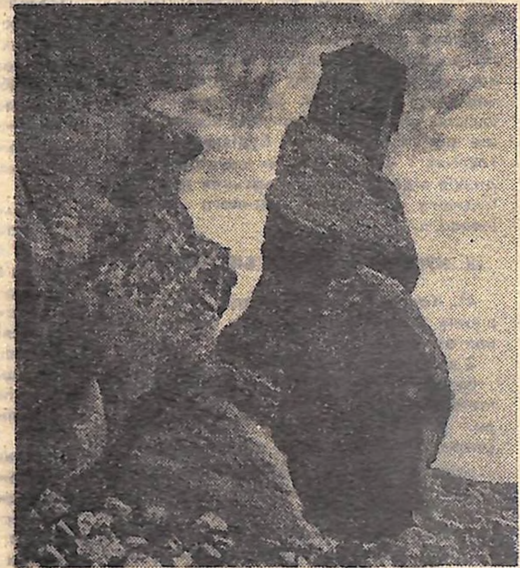
У Вірменії на скелястому виступі однієї з численних ущелин, які розсікають схили чотирьохго Арагацу, вже багато років неперушно стоять споруди древнього монастиря Архі.