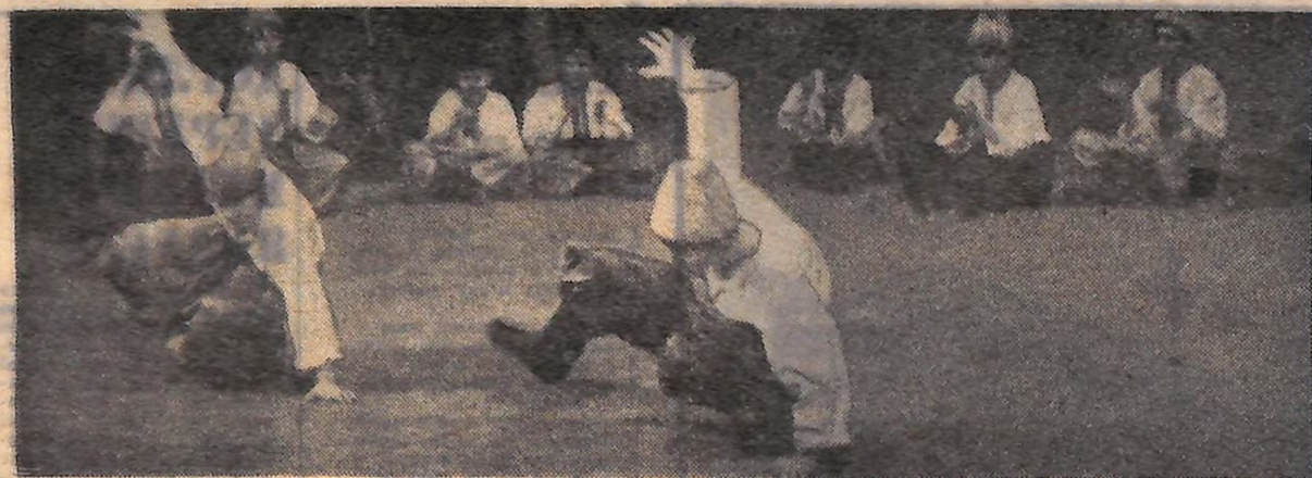
В Кіровограді проходить четверта обласна декада танцю, на якій демонструють свою майстерність робітники і колгоспники, будівельники і енергетики.