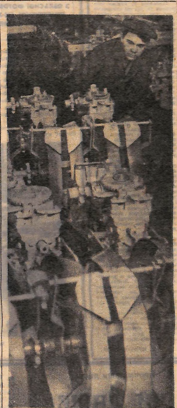
До 15 травня цього року червонозорівці обов'язково виконають державне завдання. При нормі 25 900 сівалок вже на сьогодні відвантажено із заводу 20 тисяч.