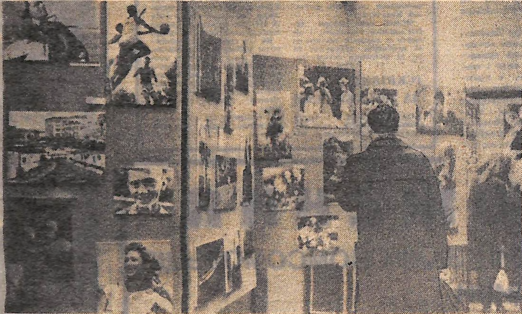
Хоч виставка відкрита лише кілька днів — її відвідали тисячі глядачів...