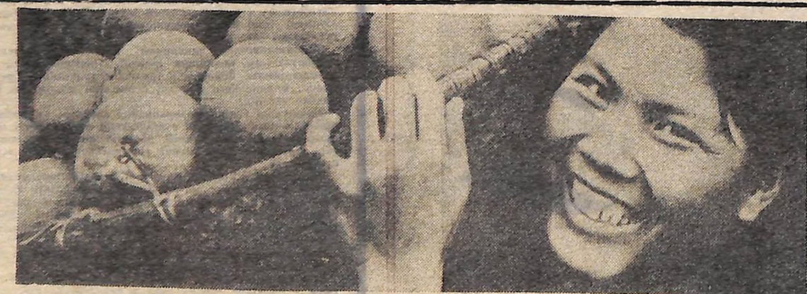
Обличчя говорять. Вони багато розповідають про В'єтнам. Знявши стальні шоломи, ці дівчата принесли апельсини з гір Хоа Бін. Вони — дівчата.

Анжей БРОНЯРЕК, польський журналіст (ЛПН). Варшава.