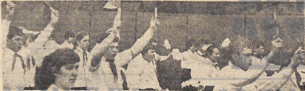
Урочисто зустріли свій Першотравень півтори обласного центру. «Тобі наш труд, наші успіхи в навчанні, Батьківщино!» рапортують вони.