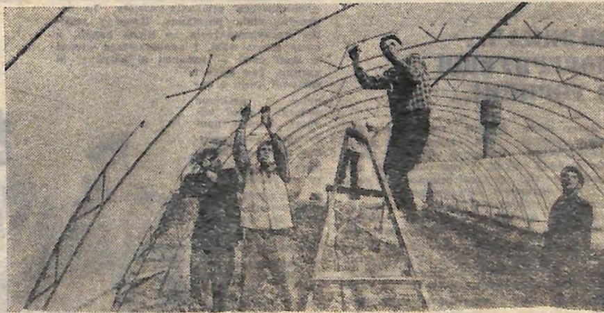
Давні дружба у студентів Кіровоградського педагогічного інституту і технікуму сільськогосподарського машинобудування з колгоспниками артлі імені Шевченка. Студенти — народ догадливий. Без пагадувань і прохань завжди допомагають. Ось і даним прийшли впорядкувати колгоспний виноградник. За один лише день роботи розкрили виноградну лозу на 29 гектарах, допомогли упорядкувати техніку.