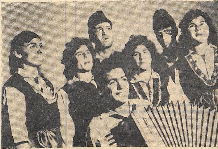
ВОКАЛЬНА ГРУПА КОМСОМОЛЬСЬКОГО КОЛЕКТИВУ ТЕЦ «МАРИЦА-СХІД».