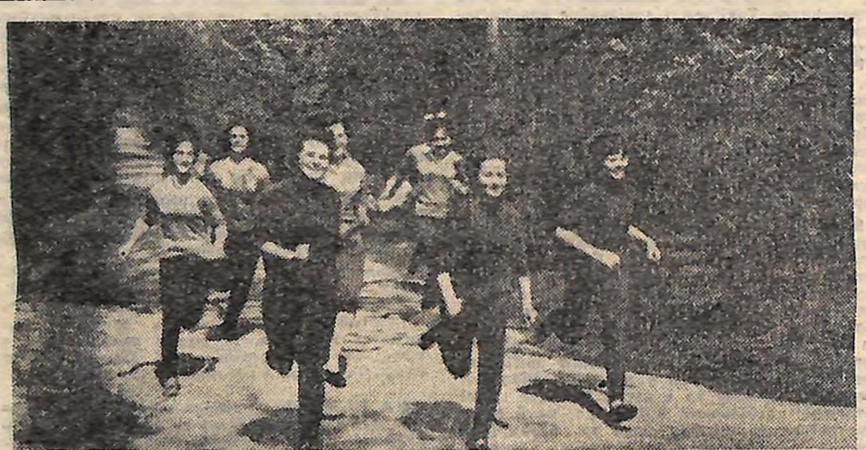
Незабаром старту легкоатлетичних змагань школярів «Олімпійська весна». Наполегаво готуються до них спортсмени Кіровоградської восьмилітньої школи № 18.