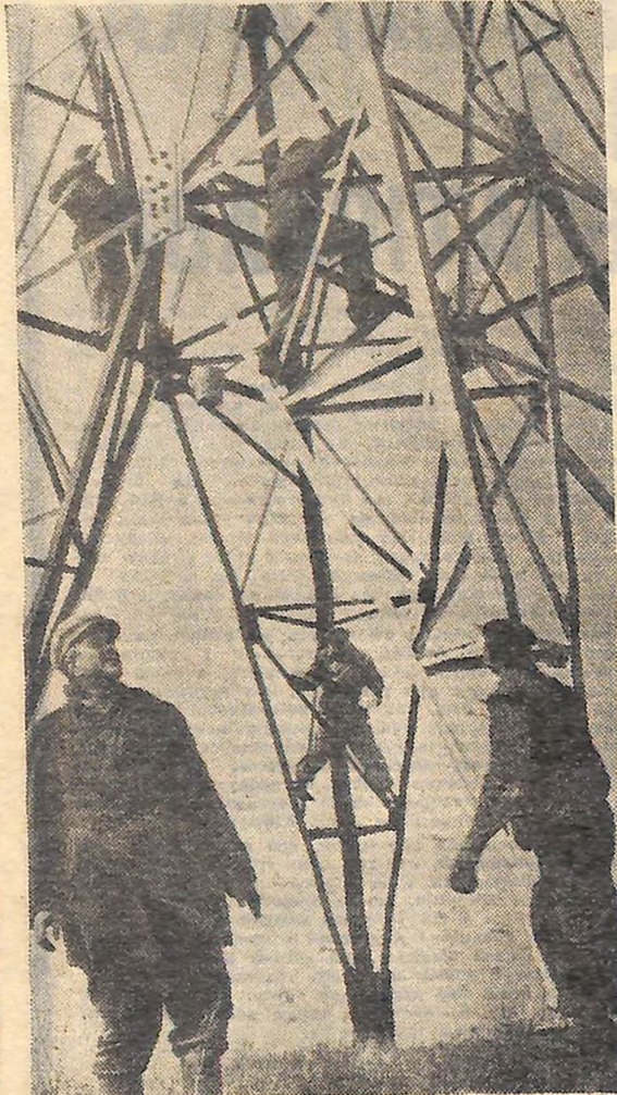
Монтажники високовольтних ліній.