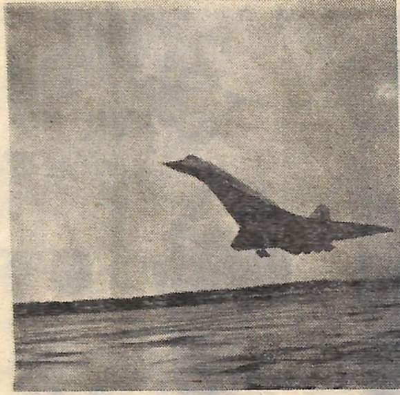
Радянський надзвуковий літак «ТУ-144» на зльоті (фото ліворуч). Праворуч — пасажирський салон літака.