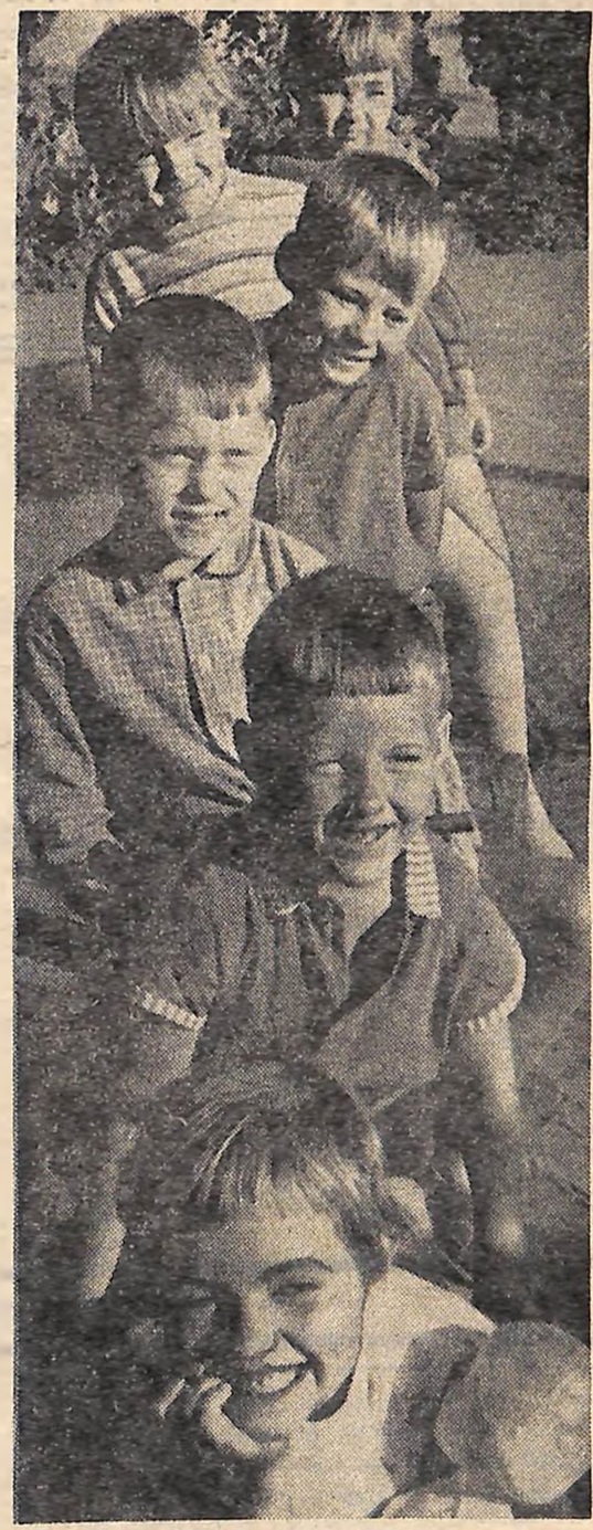
В дитячому садку міста Бобринця.