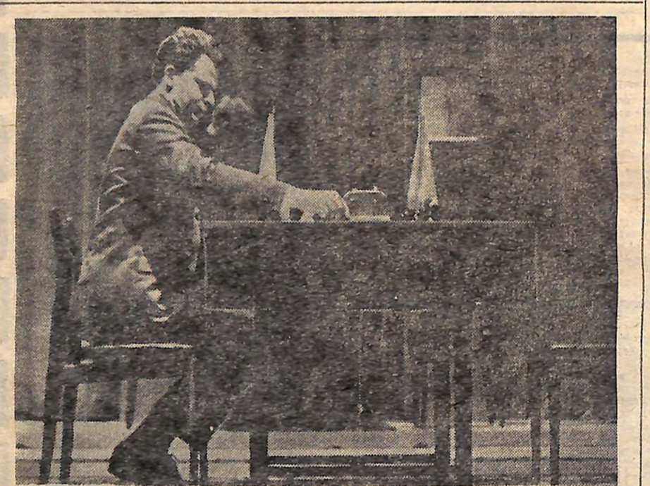
В Москві триває матч на першість світу з шахів між радянським гросмейстером Тиграном Петросяном і Борисом Спаським. Позавчора при дограванні відкладеної напередодні двадцятої партії чемпіон зумів реалізувати позиційну перевагу і добився перемоги. Рахунок став 10,5:9,5 на користь претендента. На фото: на сцені московського Театру естради, де відбувається матч. Прийшла черга задуматися Б. Спаському.

ВАЖКО НАЗДОГНАТИ «МЕТЕОР» ЖИВНИЙ ЗАХИСТ ПОЛІВ Отрутохімікати, що застосовуються для боротьби з шкідливими комахами, мають гідного конкурента — трихограму. Нову технологію та удосконалену установку для впровадження цієї комах розробили вчені українського науково-дослідного інституту захисту рослин.